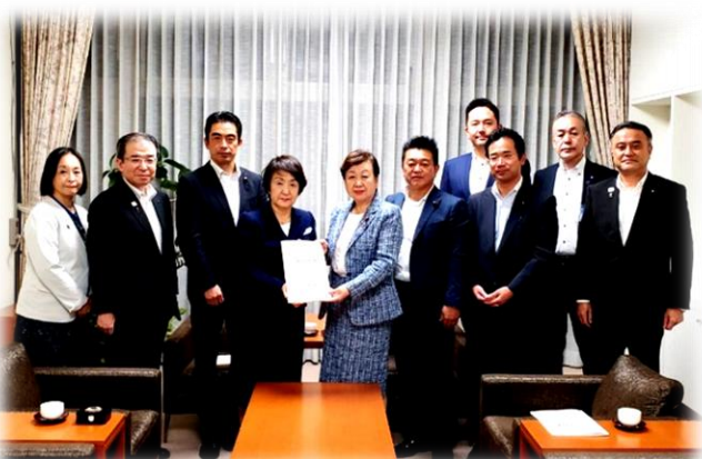
林市長・副市長4氏と会派三役