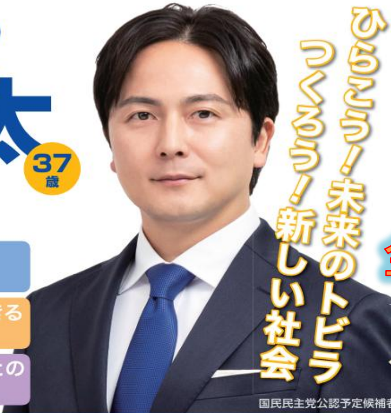
国民民主党公認予定候補者